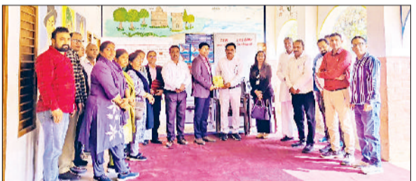
फतेहाबाद। आईडीबीआई बैंक अधिकारियों का स्वागत करते स्कूल स्टाफ सदस्य।

कॉर्पोरेट सामाजिक जिम्मेदारी और परोपकार की भावना को धरातल पर उतारते हुए आईडीबीआई बैंक ने शिक्षा के क्षेत्र में अपना सहयोग हाथ बढ़ाया है। आईडीबीआई बैंक शाखा फतेहाबाद की ओर से राजकीय माध्यमिक विद्यालय, बस्ती भलाडिया, आजाद नगर में विद्यार्थियों की सुविधा के लिए 75 हजार मूल्य की शिक्षण व अन्य सामग्री दान स्वरूप भेंट की गई। बैंक अधिकारियों ने विद्यालय पहुंचकर बच्चों की जरूरतों को ध्यान में रखते हुए सामान सौंपा, इसमें एक आधुनिक वाटर कूलर, एक लोहे की अलमारी, कक्षा कक्षों के लिए 6 नए पंखे तथा 5