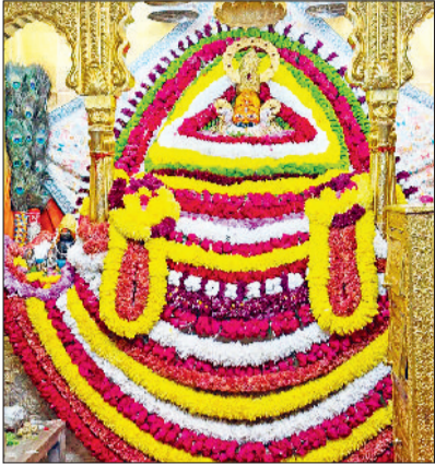
फतेहाबाद। एकादशी को लेकर सजा श्री श्याम मंदिर।