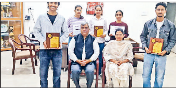
फतेहाबाद। इनोवेशन प्रतियोगिता में विजेता रहे एमएम कॉलेज के विद्यार्थियों को बधाई देते प्राचार्य।

हिसार के सीआरएम जाट कॉलेज में आयोजित इनोवेशन कॉम्पिटिशन में फतेहाबाद के मनोहर मेमोरियल कॉलेज के विद्यार्थियों ने अपनी प्रतिभा का लोहा मनवाते हुए शानदार प्रदर्शन किया है। इस प्रतियोगिता में एमएम कॉलेज की टीम ने प्रथम स्थान प्राप्त कर अपनी रचनात्मकता और तकनीकी