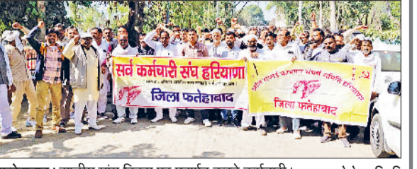
फतेहाबाद। राष्ट्रीय मांग दिवस पर प्रदर्शन करते कर्मचारी।