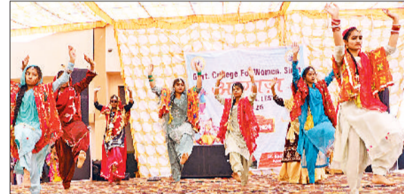
सिरसा। सांस्कृतिक प्रस्तुति देते छात्राएं।